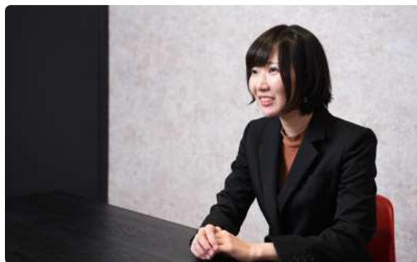
採用担当・高頭「20代の若手男女が中心になって活躍している会社です！」

入社後は、あなたもぜひ希望を発信してください。同社であれば全力で応えてくれることでしょう。いま活躍の場をIT業界に求めているなら、ぜひともご応募を。できるだけ多くの方とお会いする積極採用を実施しているのが同社です。