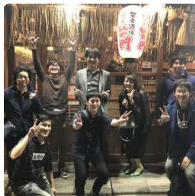
社員同士の仲の良さは◎。飲み会には会社から3000円の補助（※条件あり）が出ます。