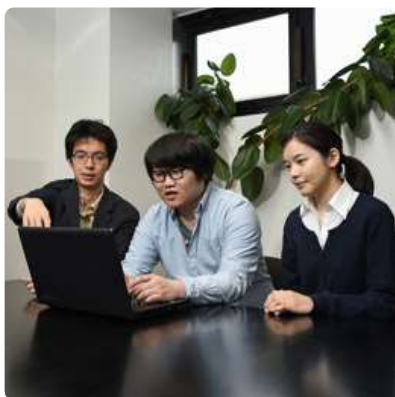
研修充実。分からない部分を社員同士で教え合う文化もあります。